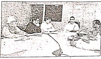
एमसीसी की अनुपालना सुनिश्चित करने के लिए हर विधानसभा क्षेत्र में 6-6 उदरनसे क्रियाशील मतदाता जागृकता के लिए चलाया जा रहा रवीय अभियान